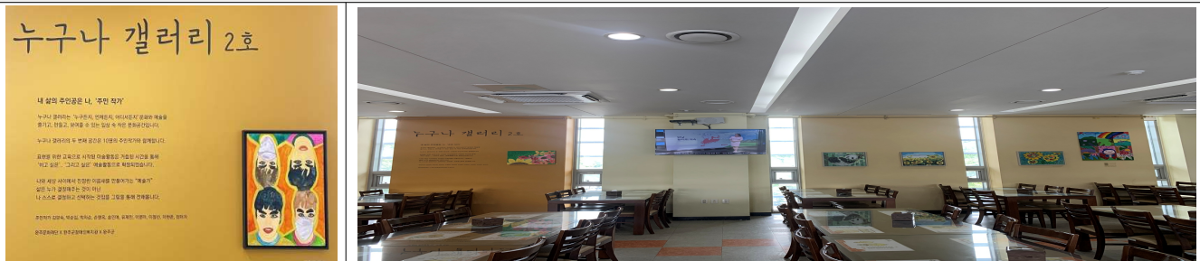
전시 공간 조성 모습 예시 2 (완주군 이서 콩쥐팍쥐도서관 3층 전시장)