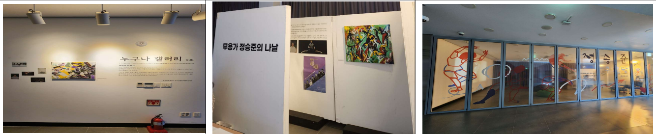
전시 공간 조성 모습 예시 3 (봉동 군부대 내 생활관 복도)